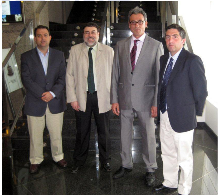
Junta Directiva AEFA

A mediados de octubre 2011, posiblemente, tendrá lugar la reunión de otoño para informar al colectivo general, de las acciones emprendidas y resultados de los temas que se encuentran en tramitación.